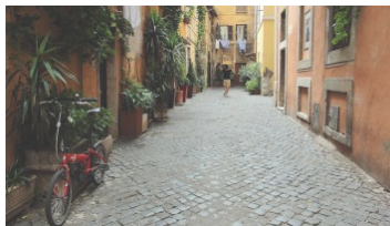
Week-end à Rome : les incontournables