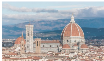
Week-end à Florence : les incontournables